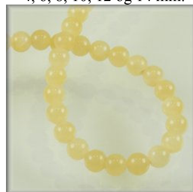
Gul Jade 4, 6, 8, 10, 12 og 14 mm.