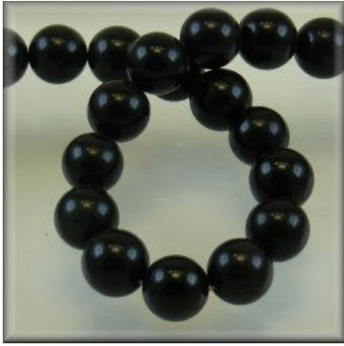
Sort Obsidian 4, 6, 8, 10, 12 og 14 mm.