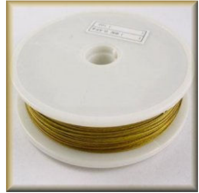
Smykkeelastik 0,8 og 1,0 mm Tiger Tail Sølv 0,38 og 0,45 mm. Tiger Tail Guld 0,38 og 0,45 mm.