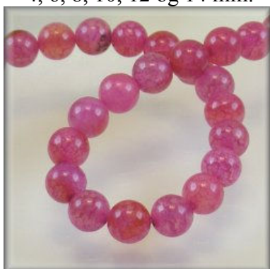
Agat Cracked Pink 10, 12 og 14 mm.