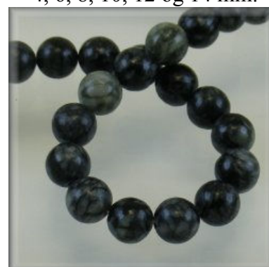
Sort Sesam (Net Stone) 4, 6, 8, 10, 12 og 14 mm.