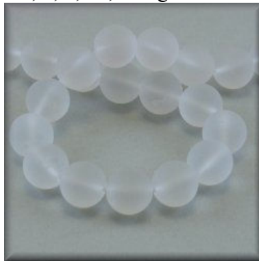
Mat Kvarts (Bjergkrystal) 8, 10 og 12 mm.