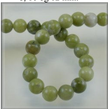
Taiwan Jade 6, 8, 10 og 12 mm.