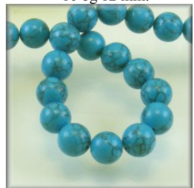
Turkis 4, 6, 8, 10, 12 og 14 mm.