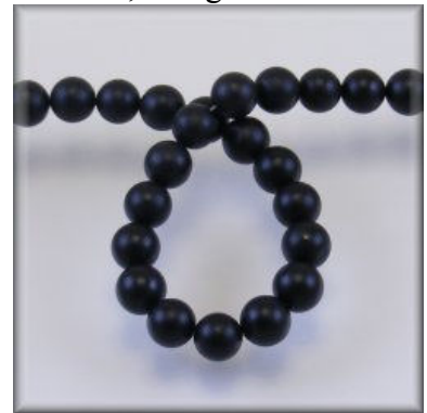
Mat Onyx 8, 10 og 12 mm.