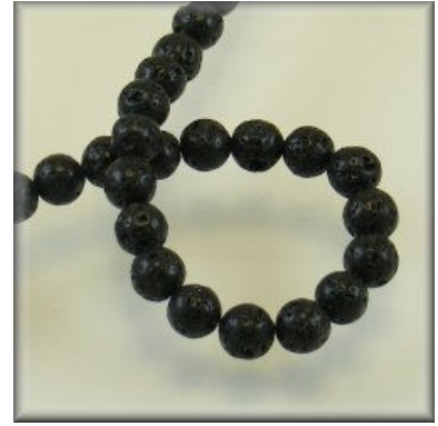
Sort Lava 8, 10 og 12 mm.