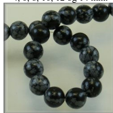
Obsidian snowflake 4, 6, 8, 10, 12 og 14 mm.