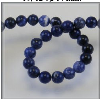
Sodalit 4, 6, 8, 10, 12 og 14 mm.