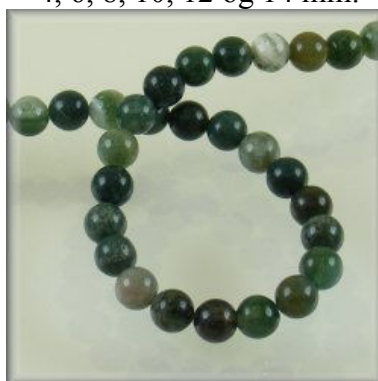
Mos Agat 4, 6, 8, 10, 12 og 14 mm.