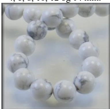
Hvid Howlit 4, 6, 8, 10, 12 og 14 mm.