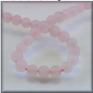
Mat Rosa Kvarts 8, 10 og 12 mm.