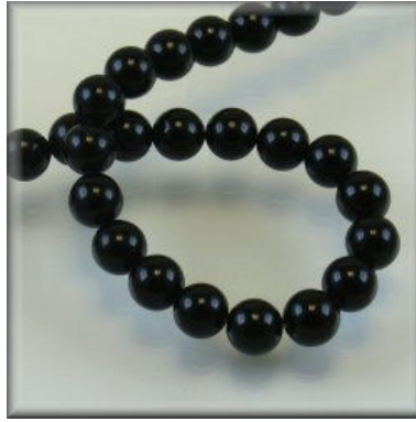
Sort Onyx 4, 6, 8, 10, 12 og 14 mm.