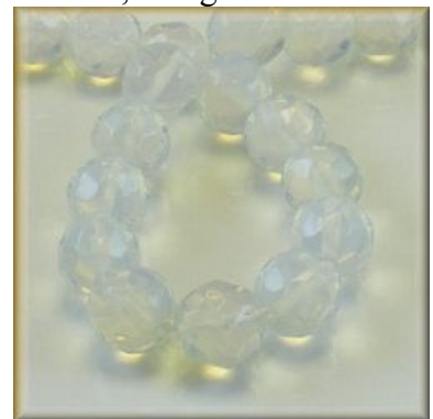
Moonstone Facet 10 og 12 mm.