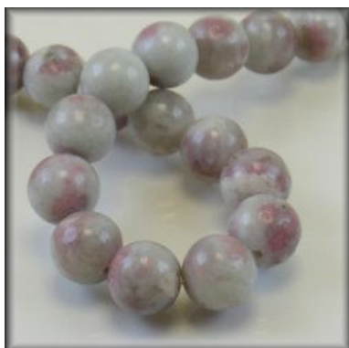
Lilla Jaspis 4, 6, 8, 10, 12 og 14 mm.