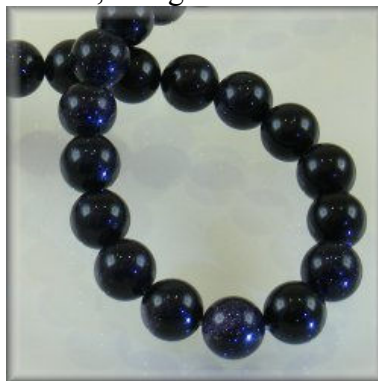
Blue Sand (Goldstone) 8, 10 og 12 mm.