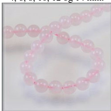
Rosa Kvarts 4, 6, 8, 10, 12 og 14 mm.