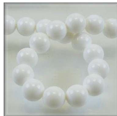
Hvid Opak Jade 4, 6, 8, 10, 12 og 14 mm.