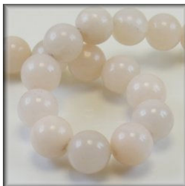
Peach Stone (Pink Aventurin) 4, 6, 8, 10, 12 og 14 mm.