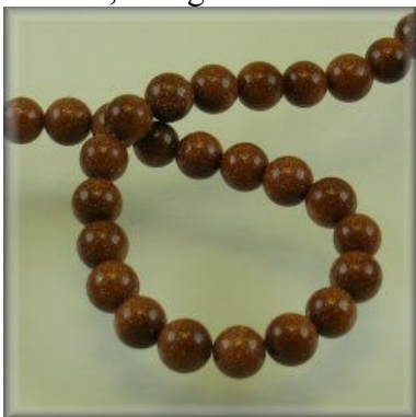
Gold Sand (Goldstone) 8, 10 og 12 mm.