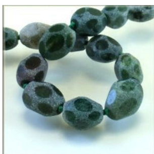
Mosagat frosted facet Nugget 18 x 25 mm