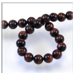
Okseøje 6, 8, 10 og 12 mm.