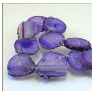
Agat farvet lilla plader 35 x 45 mm.