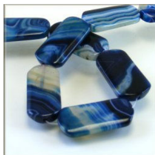
Agat farvet blåstribet 20 x 40 mm.