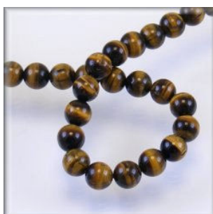
Tigerøje 6, 8 og 10 mm.