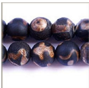
Agat farvet sort Tibetan Antik mønstret Rund 14 og 16 mm