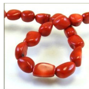
Koral Nugget ca. 11 x 13 mm.