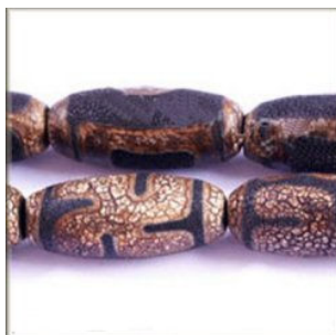
11 x 25 mm.