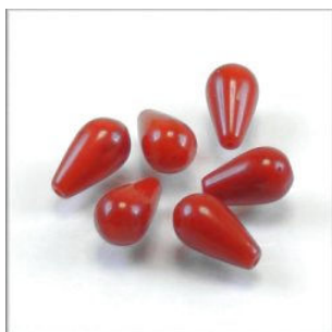
Koral dråber anboret 6 x 12 mm.