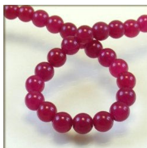
Jade farvet Fuchsia 8 mm.