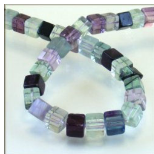
Rainbow Fluorit terning 8 x 8 mm.