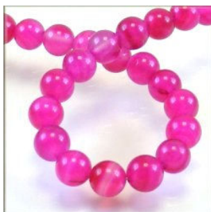
Agat farvet fuchsia 10 mm.