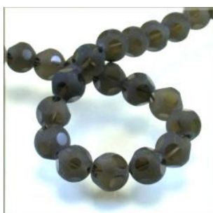
Røgkvarts mat facet 10 og 12 mm.