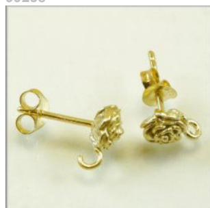
Ørestik Sterling Sølv Rose m/øje forgyldt 6 x 8 mm.