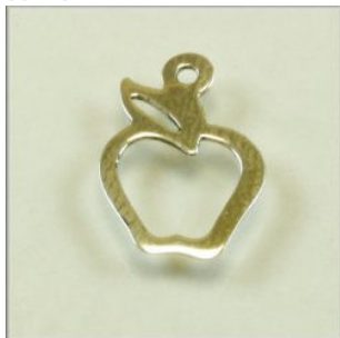
Vedhæng Sterling Sølv Æble. 9 x 13 mm.