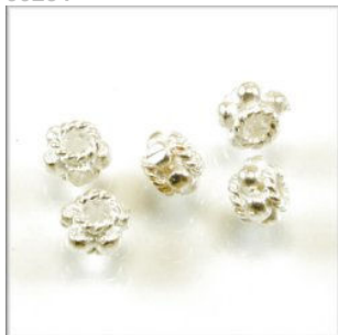
Mellempære Sterling Sølv Rondel 3 x 4 mm. Hul: 1,5 mm.