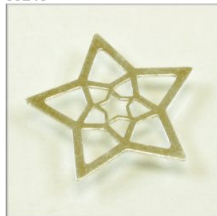
Vedhæng Sterling Sølv 5-takket Stjerne. 16 mm.