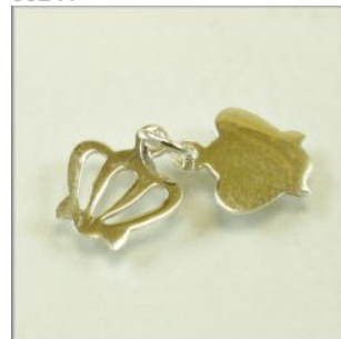
Vedhæng Sterling Sølv Dobbelt krone. Krone: 10 x 11 mm.