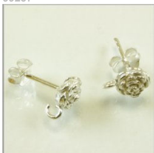
Ørestik Sterling Sølv Rose m/øje 6 x 8 mm.