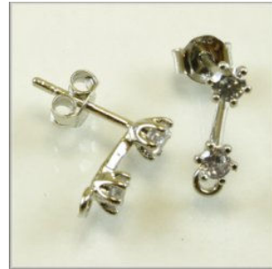
Ørestik Sterling Sølv 2 indfattede lavendel facetslebne CZ m/øje 12 mm.