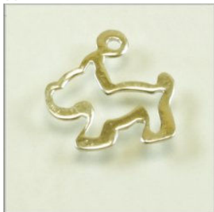
Vedhæng Sterling Sølv Humd. 12 x 12 mm.