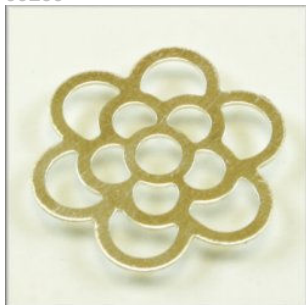
Vedhæng Sterling Sølv Blomst. Ø 20 mm.