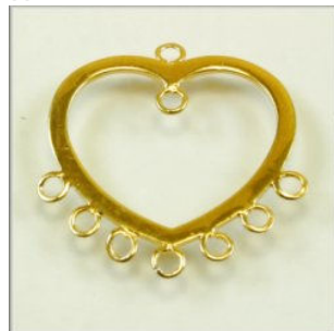
Chandalier Sterling Sølv Forgyldt Hjerte med 8 øjer. 19 x 22 mm.