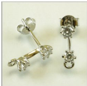
Ørestik Sterling Sølv 2 indfattede hvide facetslebne CZ m/øje 12 mm.