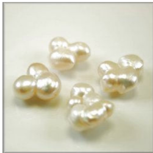
Ferskvandsperle Trilling og firling ca. 20 x 20 mm. Svag rosa, Længdeboret