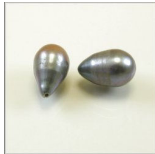
Ferskvandsperle Dråbe ca. 13 x 10 mm. Blå/lilla changerende