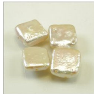
Ferskvandsperle Kvadrat 10 x 10 x 4 mm. Hvid changerende