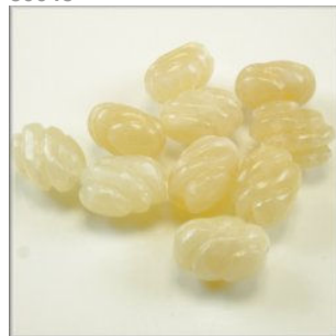
Jade - Serpentin Skrue 15 x 11 mm. Hansagul Længdeboret.