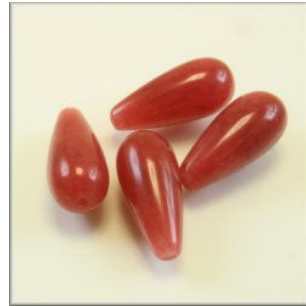
Agat Dråbe 20 x 9 mm. Kadmiumrød Længdeboret.