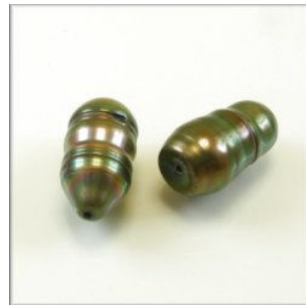
Ferskvandsperle Barok Dråbe ca. 17 x 10 mm. Blå/lilla changerende