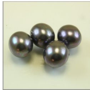
Southsea Shell Oval 13 x 15 mm. Byzantin Tværboret