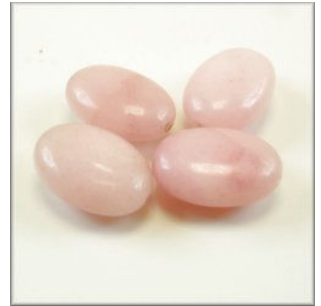
Pink Opal Oval 19 x 13 mm. Pink Længdeboret