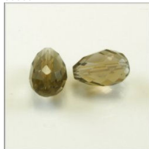
Røgkvarts Dråbe 12 x 8 mm. Længdeboret