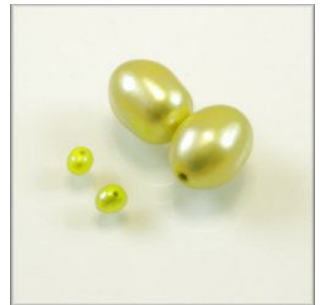
Ferskvandsperle Oval 11 x 8 mm Rund 3 mm. Olivengul