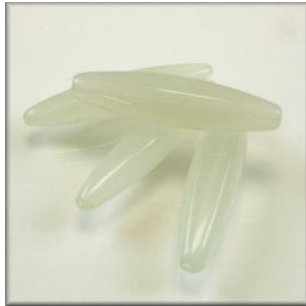
Jade - Bowenit Lang risform 21 x 7 mm. Caladon Længdeboret.