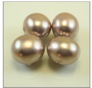
Southsea Shell Oval 13 x 15 mm. Bronze Tværboret