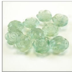
Grøn Fluorit Blomst 15 mm. Top Tværboret