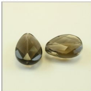
Røgkvarts Flad Dråbe 18 x 13 mm. Længdeboret