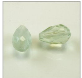
Grøn Fluorit Facet dråbe 12 x 8 mm. Længdeboret