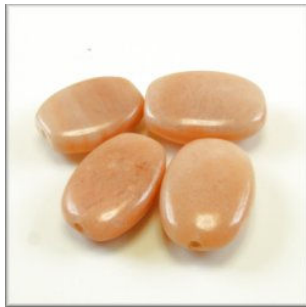
Pink Aventurin Ellipse 17 x 13 mm. Tangarine Længdeboret