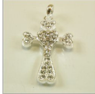
Vedhæng Kors 53 x 27 x 3 mm. Forsølvet eller forgyldt 1 stk. kr. 20,-