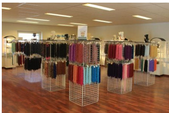
Lyse og hyggelige omgivelser

Du er altid velkommen til at komme forbi og få en hyggelig sludder, en kop kaffe og råd og vejledning i smykkefremstilling. Men du kan naturligvis altid bestille fra min hjemmeside, der har åbent døgnet rundt.