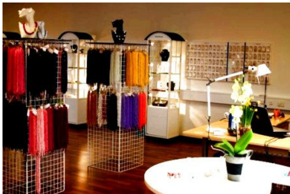
I montrene er der smykker til inspiration