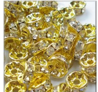
Rondel m/Rhinstene 4 mm. Forgyldt Kvalitet A 10 stk. kr. 20,-