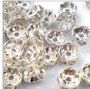
Rondel m/Rhinstene 4 mm. Forsølvet Kvalitet A 10 stk. kr. 20,-