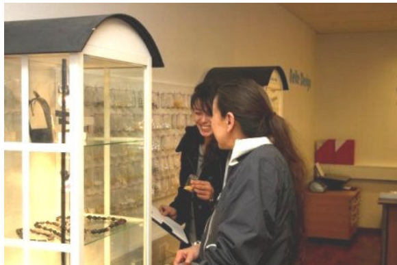
Og masser af inspiration