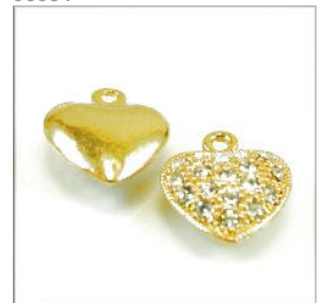
Hjertevedhæng m/Rhinstene 16 x 14 x 5 Guldfarvet 5 stk. kr. 25,-

Alle mine smykkedele er, som loven kræver, testet bly- og nikkelfri.