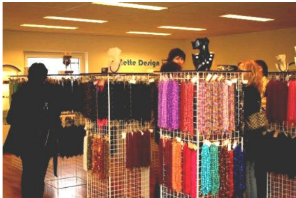
Der er over 800 varenumre i stene