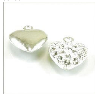
Hjertevedhæng m/Rhinstene 16 x 14 x 5 Sølvfarvet 5 stk. kr. 25,-