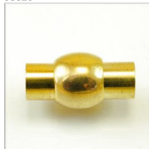
Magnetlås Passer til 5 mm læder 19 x 11 mm. Guldfarvet 1 stk. kr. 20,-