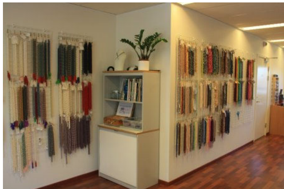
Der er et stort udvalg af ferskvandsperler