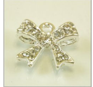
Vedhæng m/Rhinstene 16 x 13 x 4 mm. Forsølvet eller forgyldt 4 stk. kr. 20,-