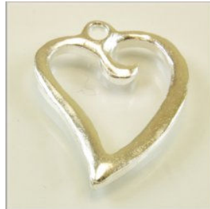
Vedhæng Hjerte 25 x 20 mm. Forsølvet eller forgyldt 5 stk. kr. 20,-