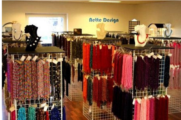
Der er et stort udvalg af smykkesten og inspiration