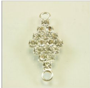
Mellemed m/Rhinstene 10 x 24 x 3 mm. Forsølvet eller forgyldt 4 stk. kr. 20,-