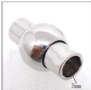
Magnetlås Passer til 5 mm læder 19 x 11 mm. Sølvfarvet 1 stk. kr. 20,-