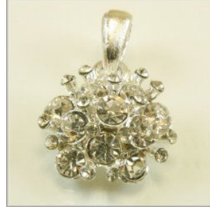
Vedhæng m/Rhinstene 26 x 22 x 9 mm. Forsølvet eller forgyldt 1 stk. kr. 20,-