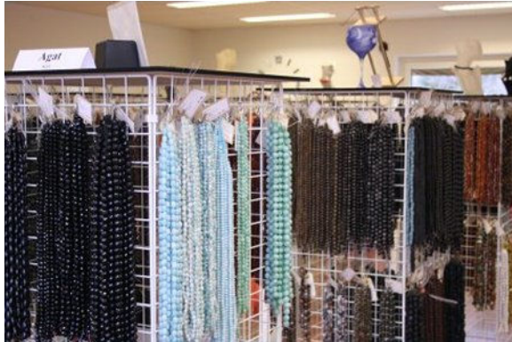
Altid de nyeste modefarver

Grundet indkøbsrejse er Webshop og Showroom lukket 4. februar – 27. februar