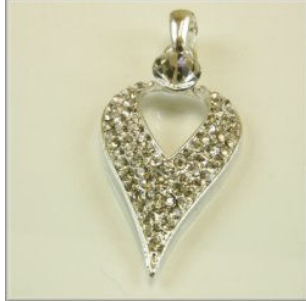
Vedhæng m/Rhinstene 50 x 27 x 7 mm. Forsølvet eller forgyldt 1 stk. kr. 20,-