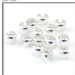
Klemme skjuler Sølvfarvet 5 mm.