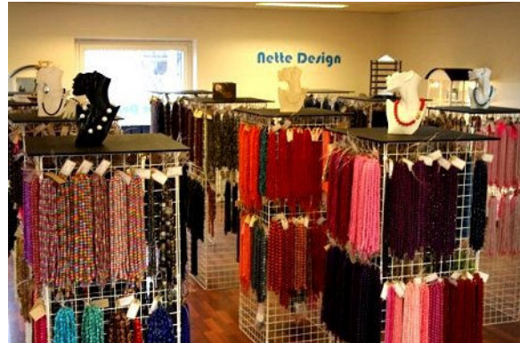
Der er et stort udvalg af smykkesten og inspiration