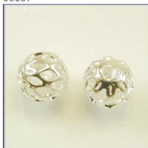
Mellempere Sølvfarvet, Hulmønster, 6 mm.