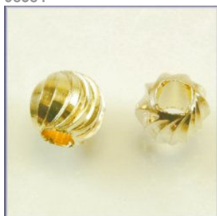
Mellempere Guldfarvet, Bue ornament, 6 mm.