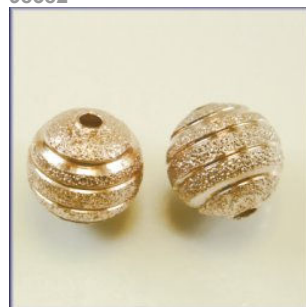
Stardust perle Rose-guld farvet, Diamond cut ringe, 10 mm.