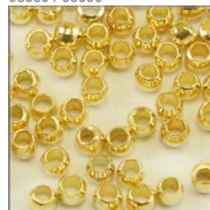
Wireklemme Sølv- og Guldfarvet, 1,5 x 1,5 mm. Velegnet til svæveperler