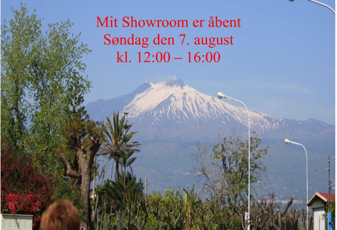
Vulkanen Etna i udbrud, Billedet er taget fra Naxos på Sicilien.

Mit Showroom er åbent Søndag den 7. august kl. 12:00 – 16:00