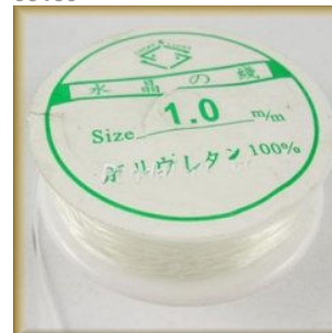
Smykke-elastic Klar Rund 1,0 mm