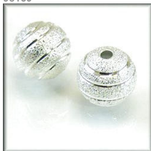
Stardust perle Sølvfarvet, Diamond cut ringe, 10 mm.