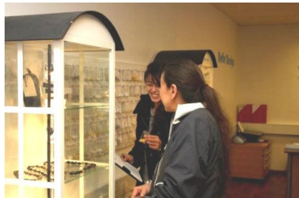
Og masser af inspiration