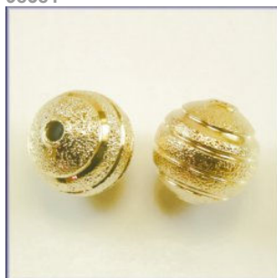
Stardust perle Guldfarvet, Diamond cut ringe, 10 mm.