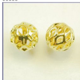
Mellempere Guldfarvet, Hulmønster, 6 mm.