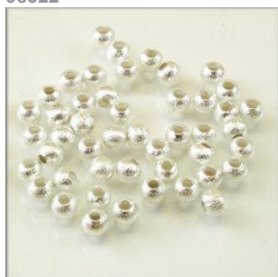
Kugle Scratched finish Sølvfarvet 4 mm.