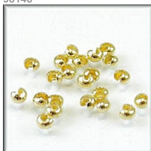
Klemme skjuler Guldfarvet 4 mm.