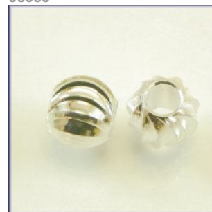
Mellempere Sølvfarvet, Bue ornament, 6 mm.