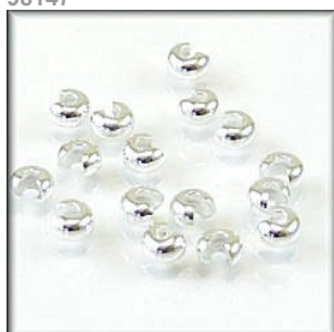
Klemme skjuler Sølvfarvet 4 mm.