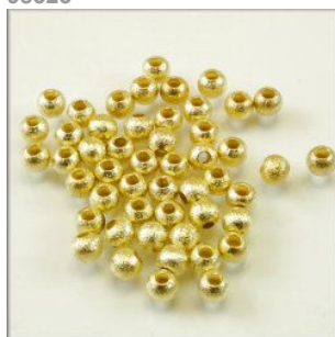
Kugle Scratched finish Guldfarvet 4 mm.